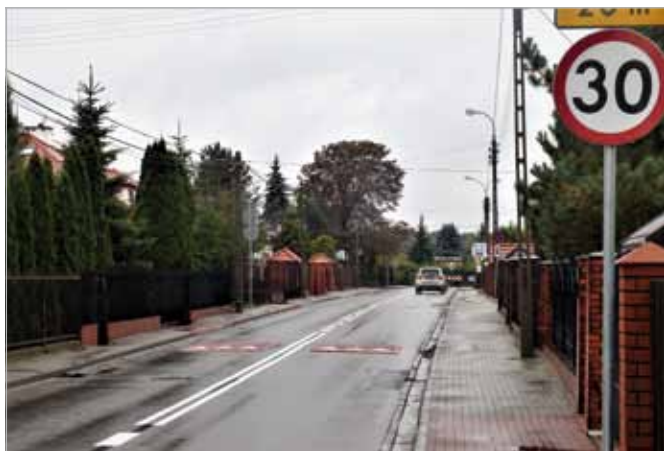
Wykończono progi zwalniające przy ul. Łaszczyńskiego w Bliznem Łaszczyńskiego