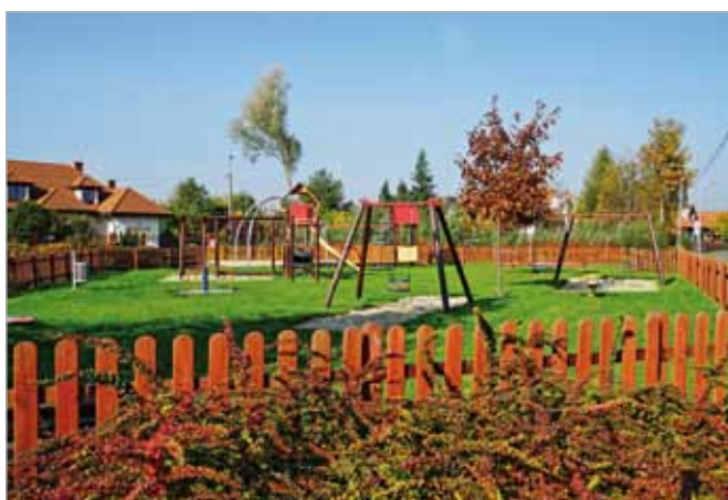
Jesień zagościła w gminie – Zielonki-Parcela