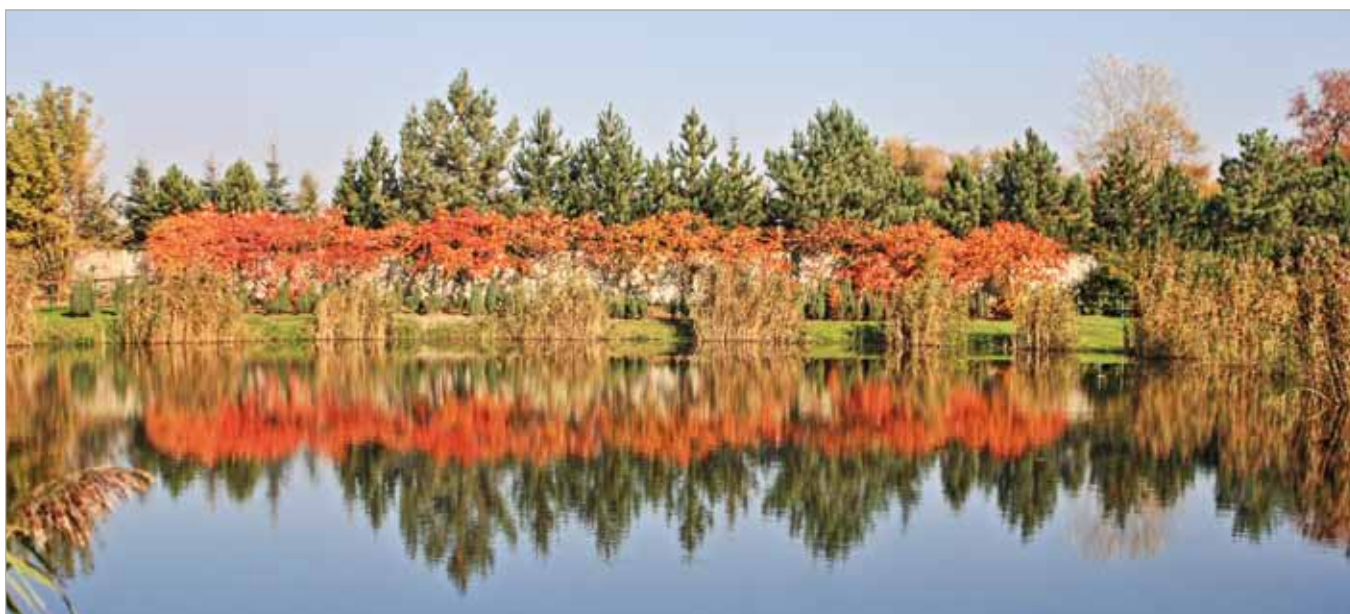
Jesień zagościła w gminie – Borzęcin Duży