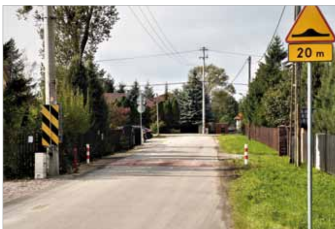
Wykończono progi zwalniające przy ul. Kontuszowej w Lipkowie