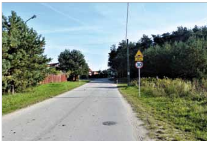
Wykończono progi zwalniające przy ul. Klonowej w Koczargach