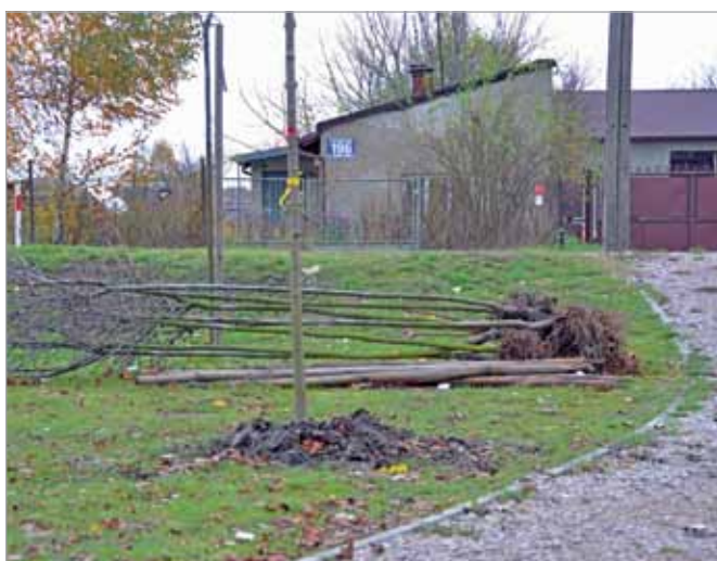
Utrzymanie gminnej zieleni: sadzenie drzew przy ul. Szeligowskiej (Latchorzew)