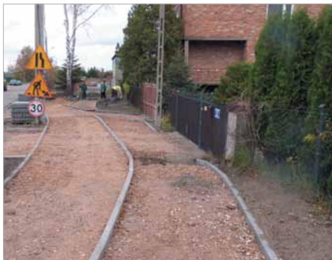
Powstaje ciąg pieszo-rowerowy przy ul. Spacerowej w Borzęcinie Dużym (oraz parking do ul. Wodnisko)