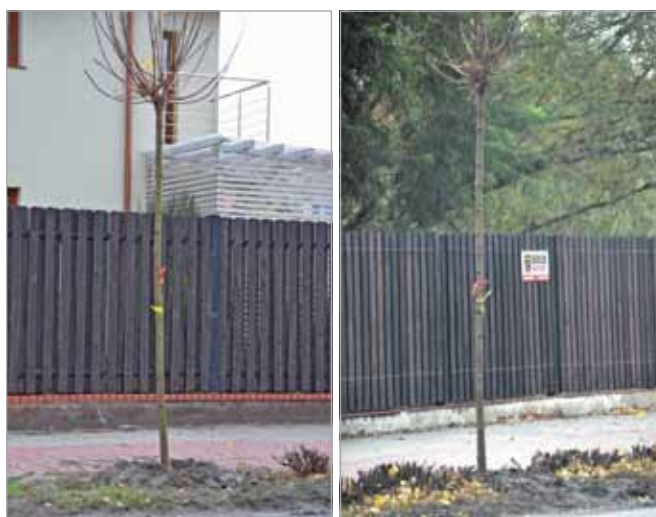
Utrzymanie gminnej zieleni: sadzenie drzew przy ul. Hubala-Dobrzańskiego (Latchorzew)