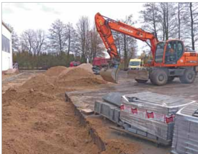
Trwa budowa boiska i placu zabaw przy I Gminnym Gimnazjum w Koczargach Starych