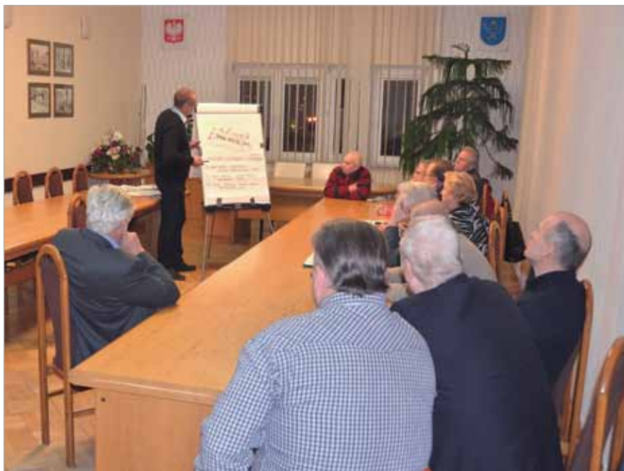
Początek spotkania z mieszkańcami Latchorzewa